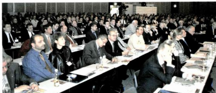
Führungskräfte unter sich: Am 2. St.Galler «KMU-Tag» werden wiederum mehr als 700 Teilnehmer/innen aus der ganzen Schweiz erwartet.