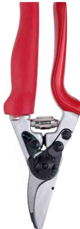
La Neuchâteloise Felco est N° 1 mondiale dans le secteur des objets de coupe, coupe-câbles et sécateurs professionnels. des mêmes écoles», dé-

de la précision chez des ingénieurs sortant