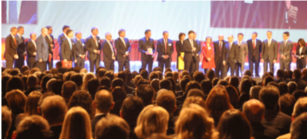
Die Gewinner, umrahmt von Jurymitgliedern und Laudatoren