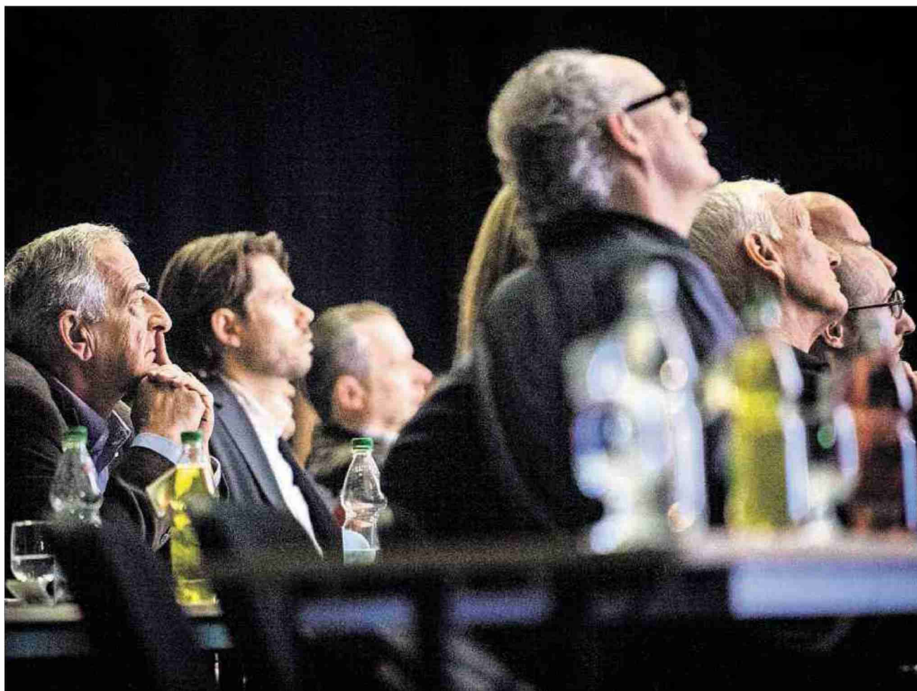
Die Teilnehmerinnen und Teilnehmer des elften Schweizer KMU-Tags ins St. Gallen kamen in den Genuss vieler spannender Referate und Diskussionsrunden.

Über 1000 Unternehmerinnen und Unternehmer, Führungskräfte und Prominenz aus Wirtschaft, Sport und Politik aus der ganzen Schweiz nahmen gestern am ausverkauften Schweizer KMU-Tag in den St. Galler Olma-Hallen teil. Sie genossen während des ganzen Tages interessante Vorträge, feine Happchen und zahlreiche spannende Begegnungen. Auf dem abwechslungsreichen Tagungsprogramm standen Workshops, Referate und Diskussionen rund um das Thema «KMU und ihr Potenzial - wie Kleine auch ganz Grosses schaffen».