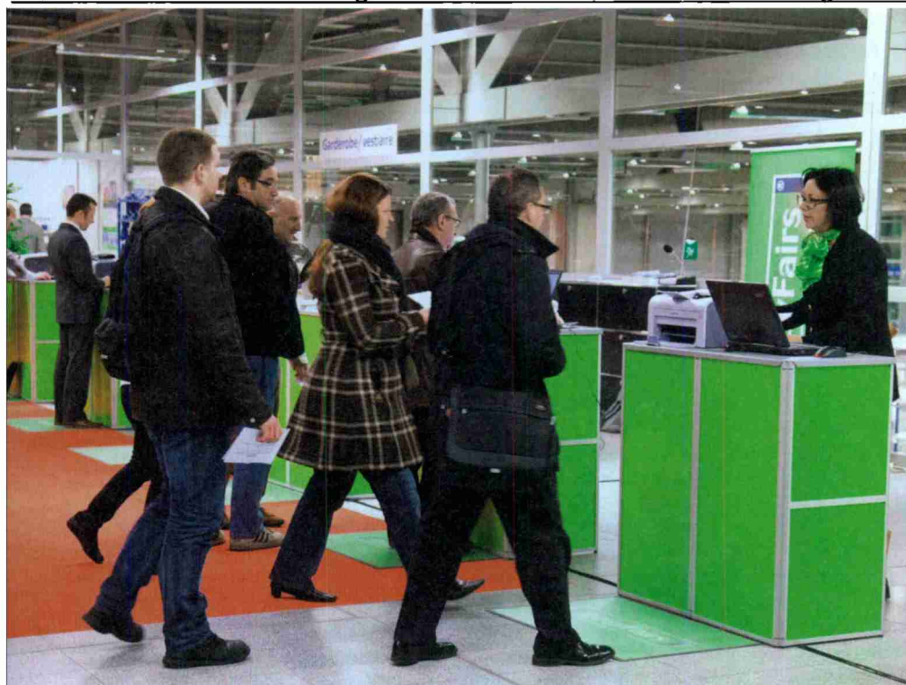
An der AUTOMATION Schweiz lassen sich Geschäftskontakte pflegen und neue Kontakte knüpfen

Mit rund 140 Ausstellern wird die AUTOMATION Schweiz 2012 , 25. und 26. Januar 2012, ihrem Ruf als umfassende Branchenplattform wieder gerecht. Die learnShops runden das Programm ideal ab, und ein Branchen-«Get together» erlaubt im Anschluss Networking mit den Branchenkennern.