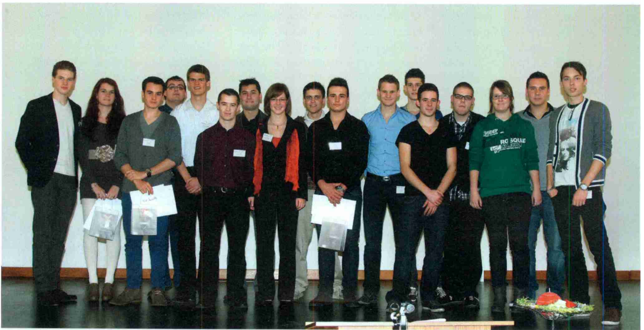
Die erfolgreich unternehmerisch denkenden und handelnden Lernenden der GIBS Solothurn.

Themen-Nr.: 377.9 Abo-Nr.: 377009 Seite: 28 Fläche: 38'684 mm 2