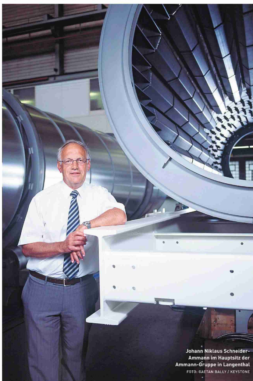
Johann Niklaus Schneider-Ammann im Hauptsitz der Ammann-Gruppe in Langenthal

Das Unternehmen des Bundesratskandidaten Johann Schneider-Ammann von A bis Z