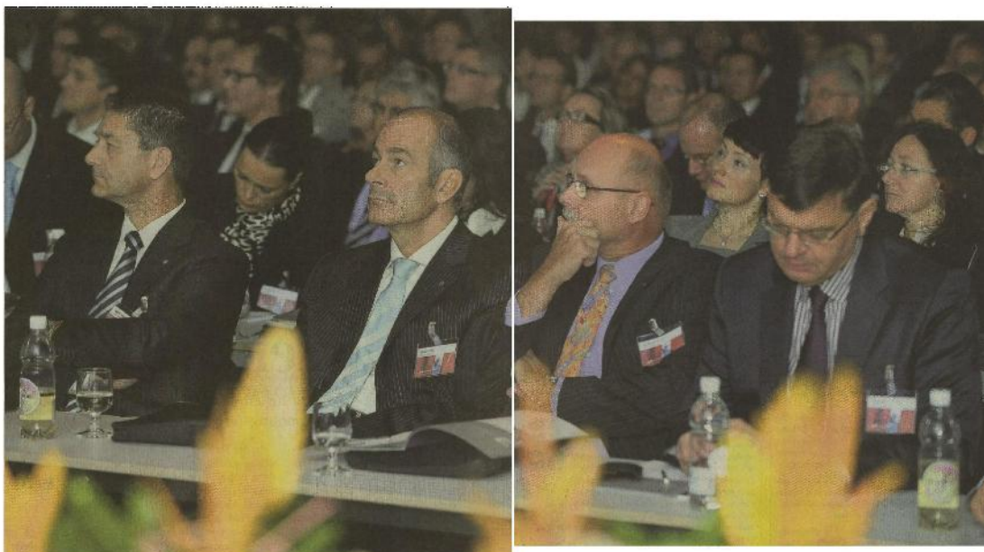
Die über 1200 Besucherinnen und Besucher des Schweizer KMU-Tags in der Olma-Halle 9 kamen in den Genuss spannender Referate und humorgespickter Moderationen.