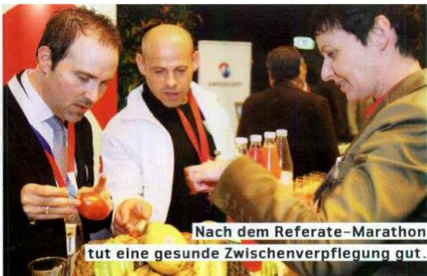
Nach dem Referate-Marathon tut eine gesunde Zwischenverpflegung gut.