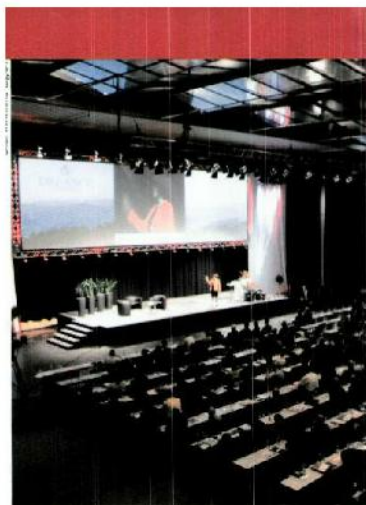
Erwartet werden zum diesjährigen «Schweizer KMU-Tag» in St.Gallen wieder rund 900 Teilnehmende.