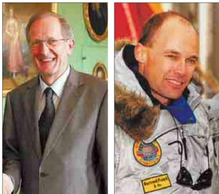
Zwei der namhaften Referenten am KMU-Tag: Bundesrat Joseph Deiss, Arzt und Ballonfahrer Bertrand Piccard.